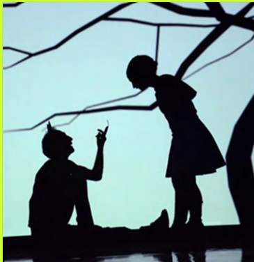
Les enfants de la classe de CP