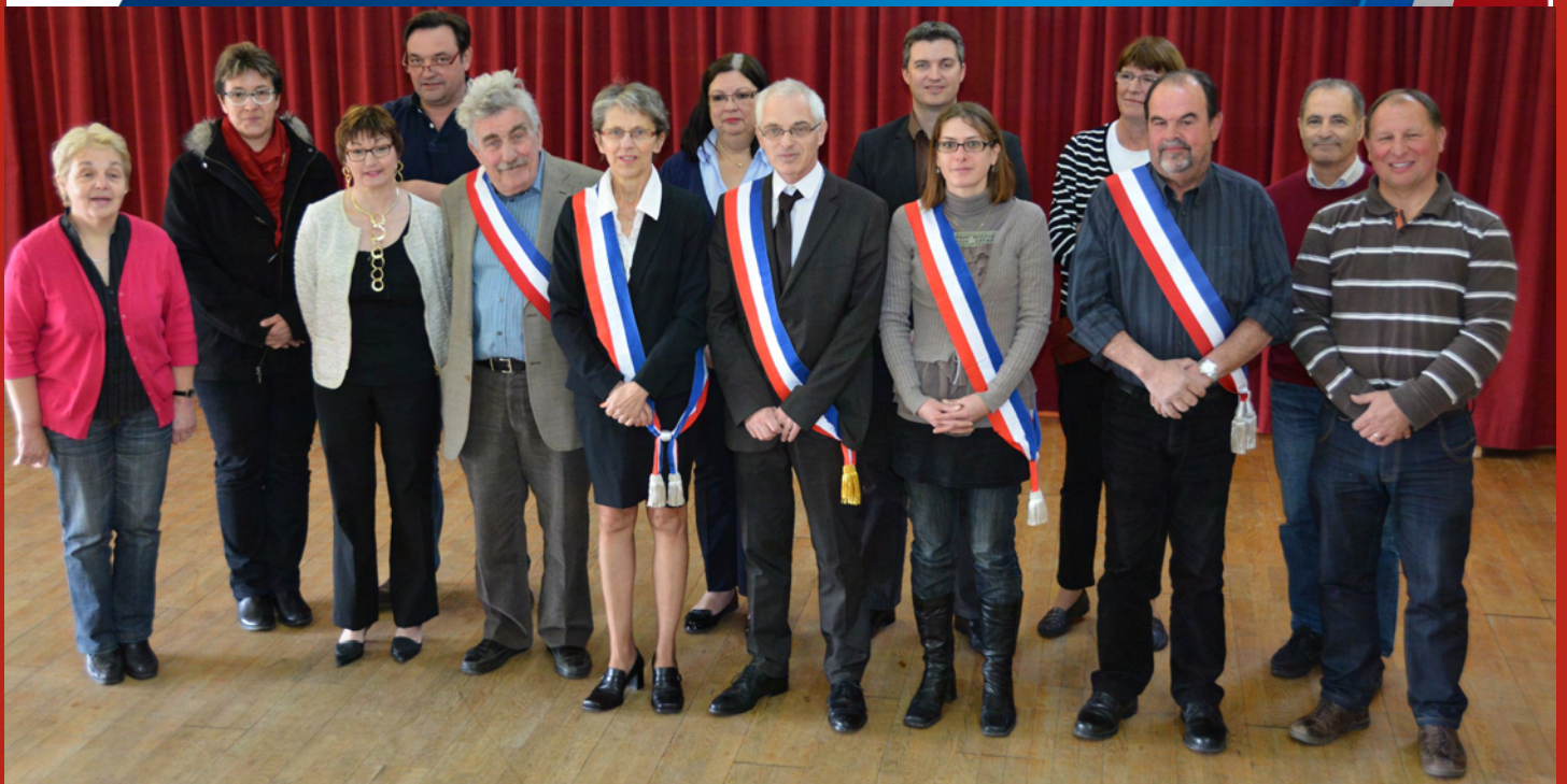
La nouvelle équipe municipale